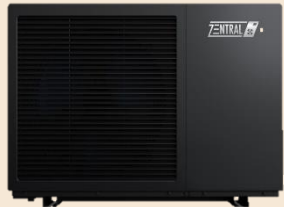
Zentral Monoblock R290 Luftwärmepumpe Typ BLN-012TC3