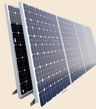
Austa Topcon Monokristalline Solar Module Topcon Technologie mit verbesserter Lebensdauer Nominalleistung-PMAX: 415Wp, Gesamt:8,3kWp Modulwirkungsgrad nm (%): 21.25% 0,42% max. jährliche Degradation Modulmaße: 1.722x1.134x30mm Gewicht: 21,5kg Farbe: Schwarz 12 Jahre Produktgarantie auf die Verarbeitung 30 Jahre Leistungsgarantie