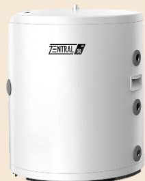
Zentral Pufferspeicher 150 l / 200 l