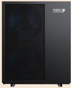
Zentral Monoblock R290 Luftwärmepumpe Typ BLN-018TC3