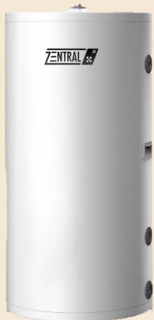
Zentral Wärmepumpenspeicher 200 l / 300 l