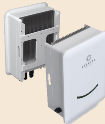
Hybrid Wechselrichter Hersteller: Stealth Energie ST-INV-T8,0 / 3-phasig AC-Nennleistung: 12kVA MPP Spannungsbereich: 180A-950A Wirkungsgrad/ Euro. Wirkungsgrad: 99,9%/97,5% Maße(B/H/T): 457mm/654mm/228mm 7 Jahre Hersteller Garantie/ 15 Jahre (optional)